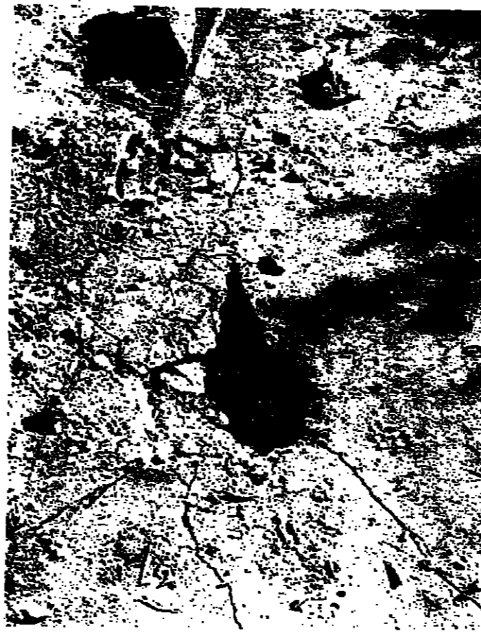
الحفرة التي احتضنت المفخرة

تقديرا للشهيد الذي تولى مهامه في مجلة الاكاديمية ويومي الأحد والاتباع ١٦ و ١٧ الجاري في منزل التقيد شارع الكورنيش في كمنية سمار انطونيوس اللوزنية - الرحيل .